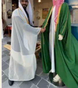
بشت الاخضر السعودي.